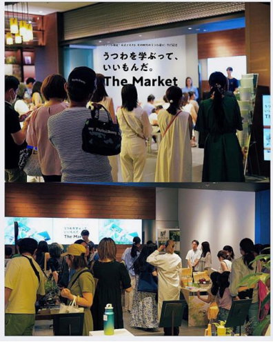
蔦屋家電 二子玉川