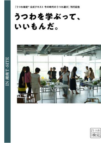
蔦屋家電 湘南Tサイト