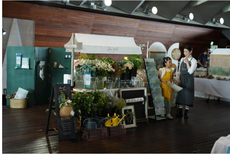
横浜 大榎橋ホール フリーマガジン1000枚配布